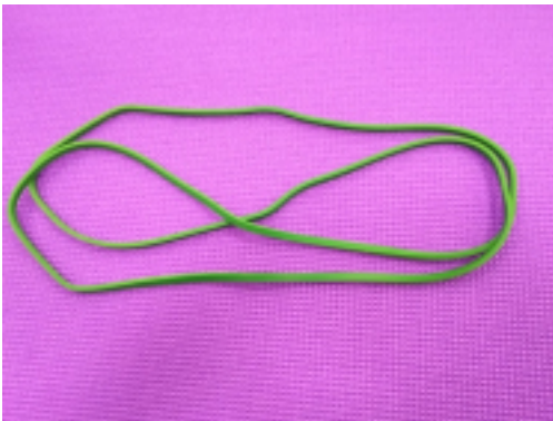
Յ-Ն•Ճ չԾ°Ճ 1 / 2 Ճ՛ՃմՆԵ Ճ՛Ճ»Ն• Ն,,Ճ, Ն,Ճ 1 / 2 ՃմՆ•Ճ° Ճ•Ճ°Ճ 1 / 4 Ճ°Ճ 1 / 2 ՆfՆ,Ն՝Ճ 1 208*0.7*045 Ն•Ճ 1 / 4 Ճ•Ճ°Ճ 3 ՆԵՆfՃ•Ճ°Ճ° Ճ 3 / 4 Ն, 1 Ճ՛Ճ 3 / 4

Յ-Ն•Ճ չԾ°Ճ 1 / 2 Ճ՛ՃմՆԵ ՆԵՃմԹ•Ճ, Ճ 1 / 2 Ճ 3 / 4 Ճ 2 Ն՝Ճ 1 Ճ չԾմՆ,Ճ»Ն• MAGNUM Ճ Ճ°Ճ•Ճ 1 / 4 ՃմՆԵ:208*2.1*0.45 [ՃԿՃ 3 / 4 Ճ՛ՆԵՃ 3 / 4 Ճ±Ճ 1 / 2 ՃմՃմ...]