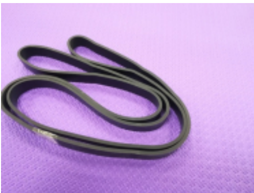
Յ-Ն•Ճ չԾ°Ճ 1 / 2 Ճ՛ՃմՆԵ ՆԵՃմԹ•Ճ, Ճ 1 / 2 Ճ 3 / 4 Ճ 2 Ն՝Ճ 1 Ճ չԾմՆ,Ճ»Ն• MAGNUM

Յ-Ն•Ճ չԾ°Ճ 1 / 2 Ճ՛ՃմՆԵ ՆԵՃմԹ•Ճ, Ճ 1 / 2 Ճ 3 / 4 Ճ 2 Ն՝Ճ 1 Ճ չԾմՆ,Ճ»Ն• MAGNUM 2-15 Ճ°Ճ 3 . Ճ Ճ°Ճ•Ճ 1 / 4 ՃմՆԵ:208*1.3*045 [ՃԿՃ 3 / 4 Ճ՛ՆԵՃ 3 / 4 Ճ±Ճ 1 / 2 ՃմՃմ...]